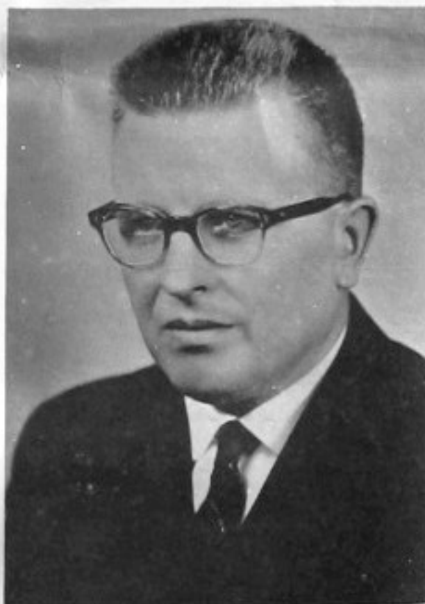
Předseda České národní rady ČESTMÍR CISAR