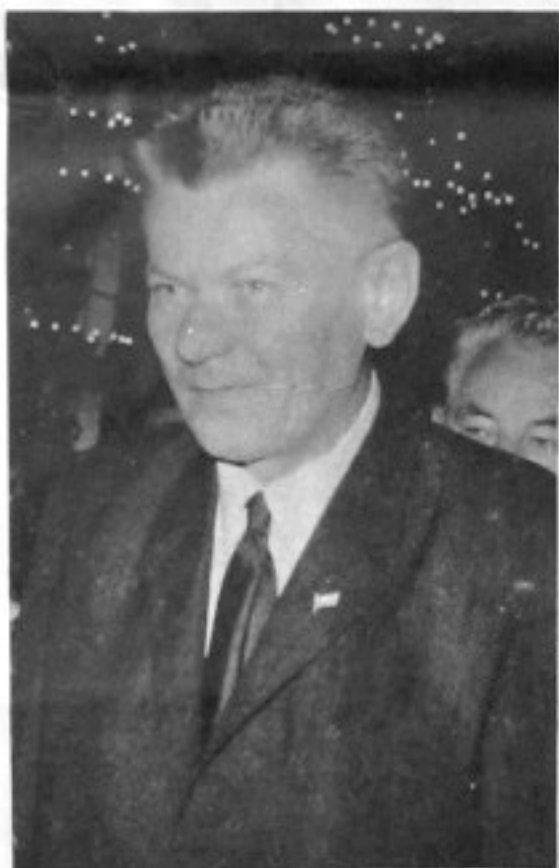
Předseda Národního shromáždění JOSEF SMRKOVSKÝ