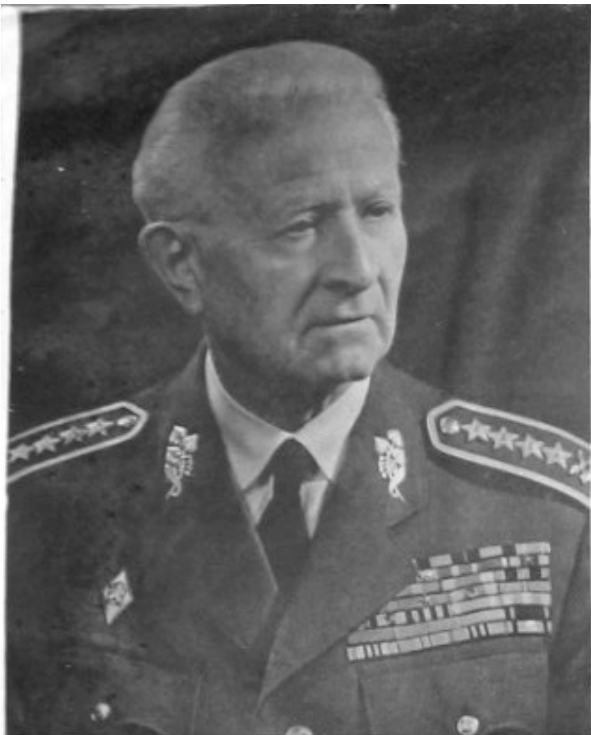
Prezident republiky LUDVÍK SVOBODA