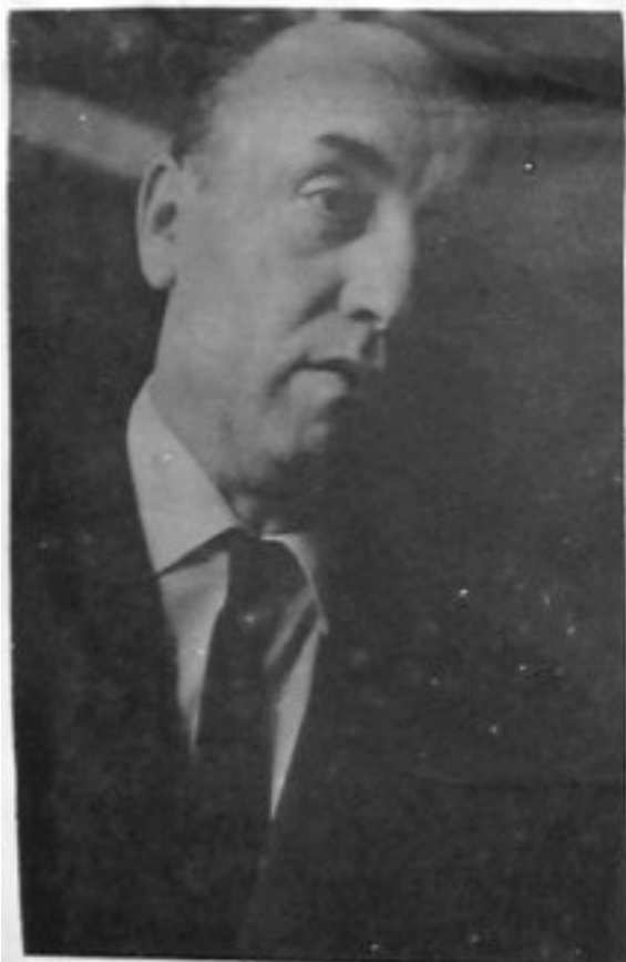
Předseda vlády OLDŘICH ČERNÍK