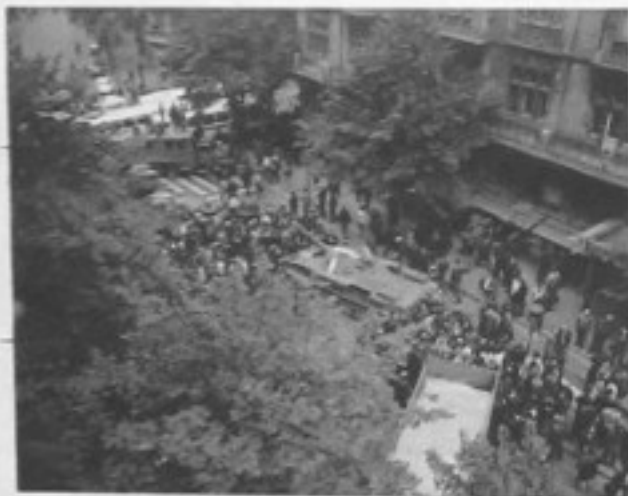
Před Československým rozhlasem — jako vždy při okupaci.