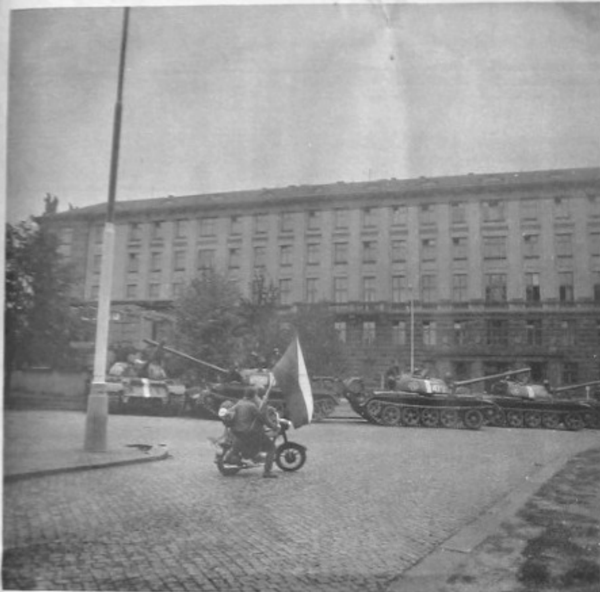
Komunisté navštívili komunisty na nejvyšší úrovni — podle představ politbyra ÚV KSSS. Na snímku budova ÚV KSC.