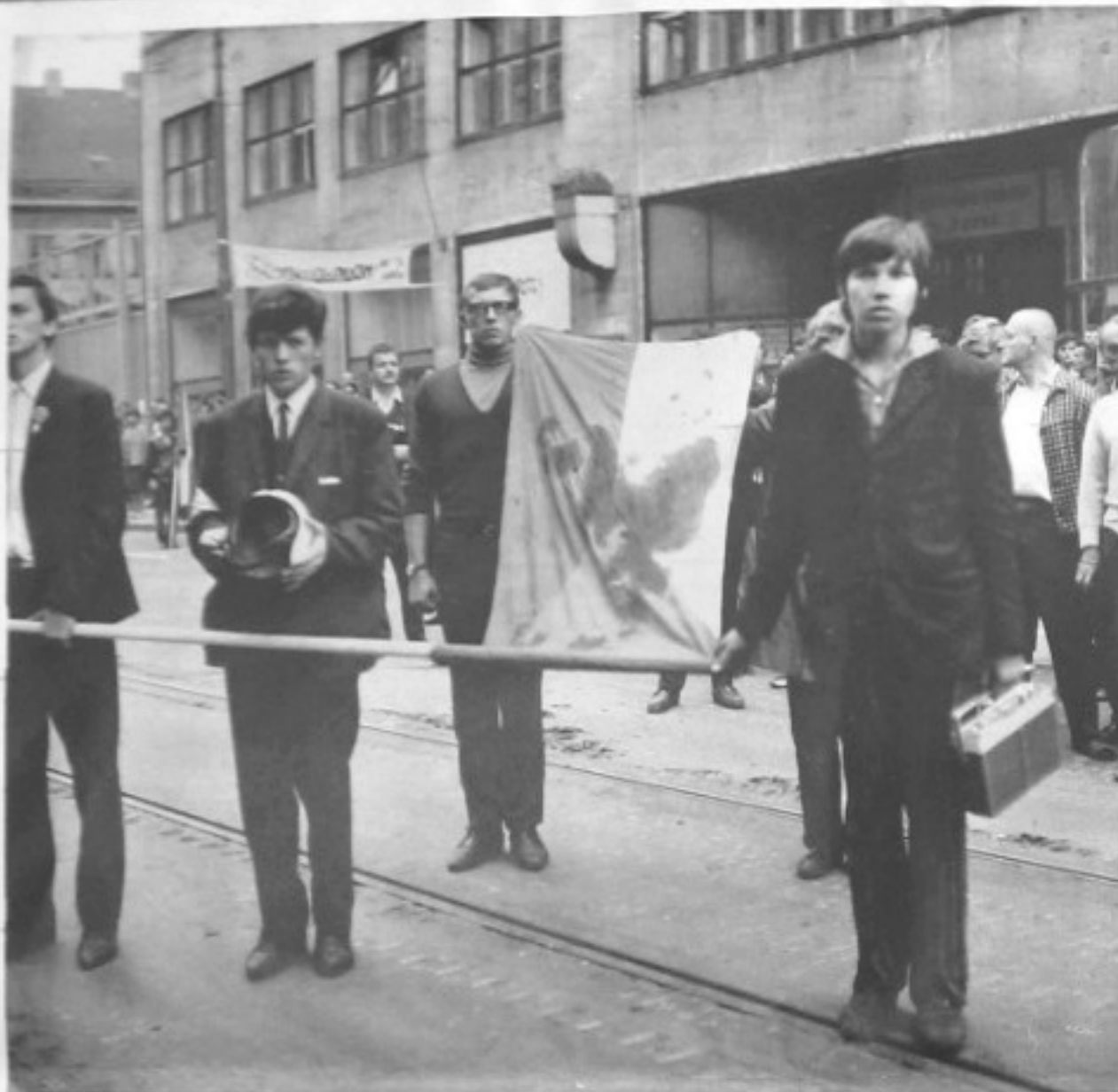
Opět jedna generace zestárá za hodinu o několik let.