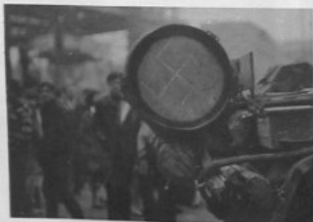
Znamení hanby, hanby, hanby.