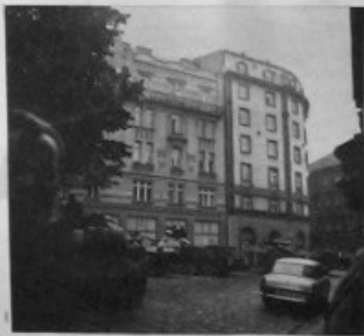
Hotel Praha za Pražskou bránou — hnízdo zrady!

Proslýchá se, že okupanti věděli, v kterém závodě sjezd za- sedá. Dokonce přišli do závodu na dobře připravené anonymní udání. A našli muže v civilu shromážděné ve velkém sále v plném jednání. Políř byla jen v tom, že tyto muži nebyli sjezdem strany, ale nevyvraceli možnost, že jím jsou. Těch pár hodin, než okupanti pochopili, měl sjezd k dobru pro ne- rušené jednání.