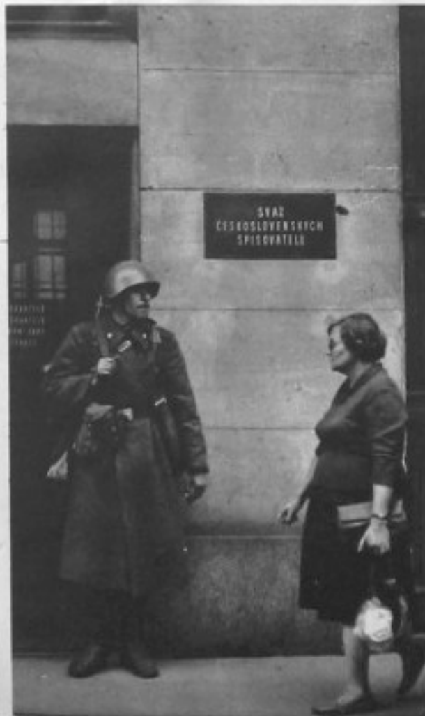
Ducha můžete hlídat, ale nezničíte jej!