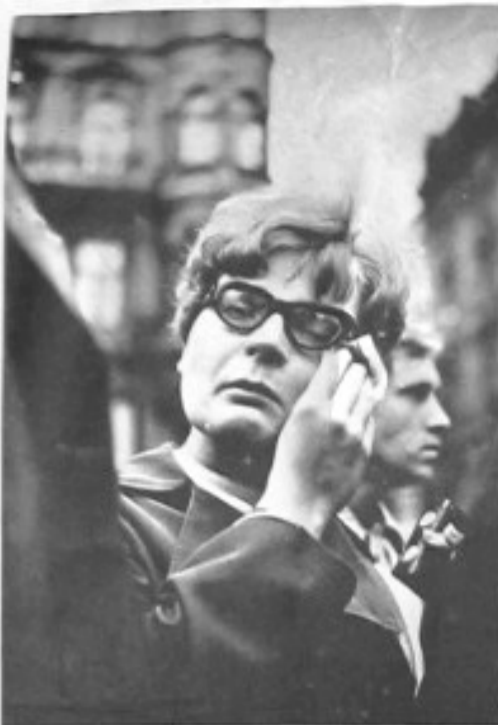
▼ V Praze byli mrtví